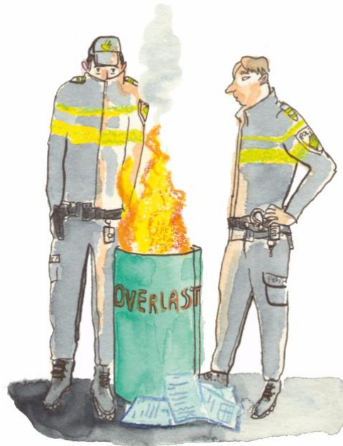
Illustratie: de Groene Amsterdammer

De politie houdt regelmatig strafbare feiten buiten de boeken en manipuleert de registratie van criminaliteit en opgeloste misdaden. Agenten ontmoedigen burgers bij het doen van aangiften, registreren misdrijven als overtredingen en noteren zaken als 'opgelost' terwijl ze dat niet zijn.